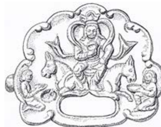
3-сурет – Тәжі киіп тақта отырған қағанның алтыннан құйылған бейнесі (салған Қ. Ахметжан)

Оңтүстік-шығыс бөліктен анықталған темір бұйымдар жиынтығынан бірнеше жұп үзеңгілер және айылбастар, жоғарғы қабатында ауыздықтар мен сулықтар және де жебе ұштары орналасқан (сурет 5). Үзеңгілердің арасында бір жұп үзеңгі күміс немесе қола металдан жасалған, ал қалған үзеңгілер темірден жасалған. Ат әбзелдері шоғырланған темір бұйымдар жиынтығы блок түрінде тұтас алынды.