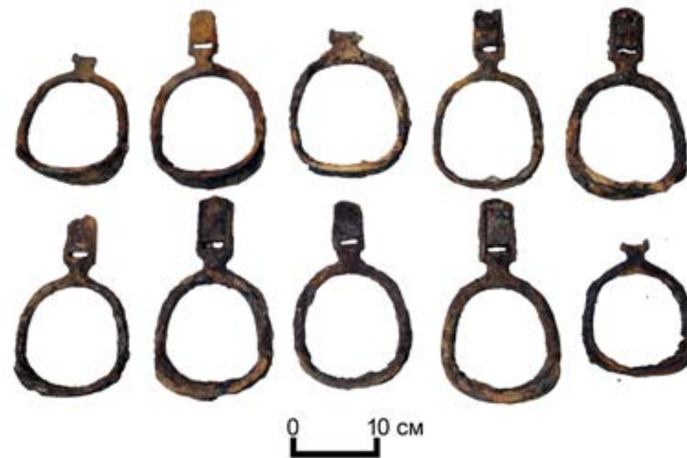
5-сурет – Ғибадатхананың ішіндегі көмбе. Ауыздық, сулық, үзеңгі және т.б.