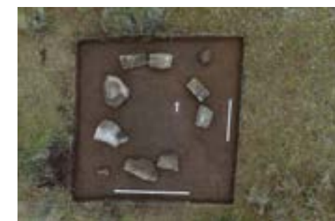
3-сурет – Көкентау. Сегіз тас. Тазаланғаннан кейінгі көрініс.