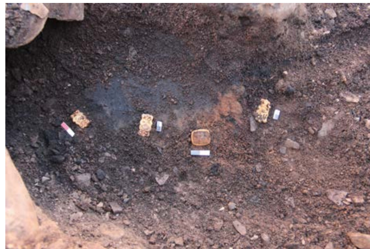
2-сурет – Қаған кешені. Өсімдік өрнегі үлгісінде жасалған әшекей бұйымдар

Кешен құрылысының ішкі бөлігінің орталық нүктесінен оңтүстікке қарай 3 м жерден өсімдік үлгісіндегі өрнегі бар әшекей бөлігі табылды, оның төменгі бөлігі бірге сақталған болып шықты. Орталық нүктеден оңтүстік-батысқа қарай 3 м жерден бір бұрышы сынған төрт бұрыш пішінді өсімдік үлгісіндегі өрнегі бар әшекей және жүрекше пішінді әшекей табылды (сары түсті металл). Орталық нүктеден солтүстік-батысқа қарай 1,6 м қашықтықтан пішіні мысық тұқымдастардың құлағына ұқсас әшекей табылды. Орталық нүктеден батысқа қарай 3 м қашықтықтан қоладан жасалған, пішіні үш жапырақшалы гүл тәрізді әшекей табылды (сурет 2).