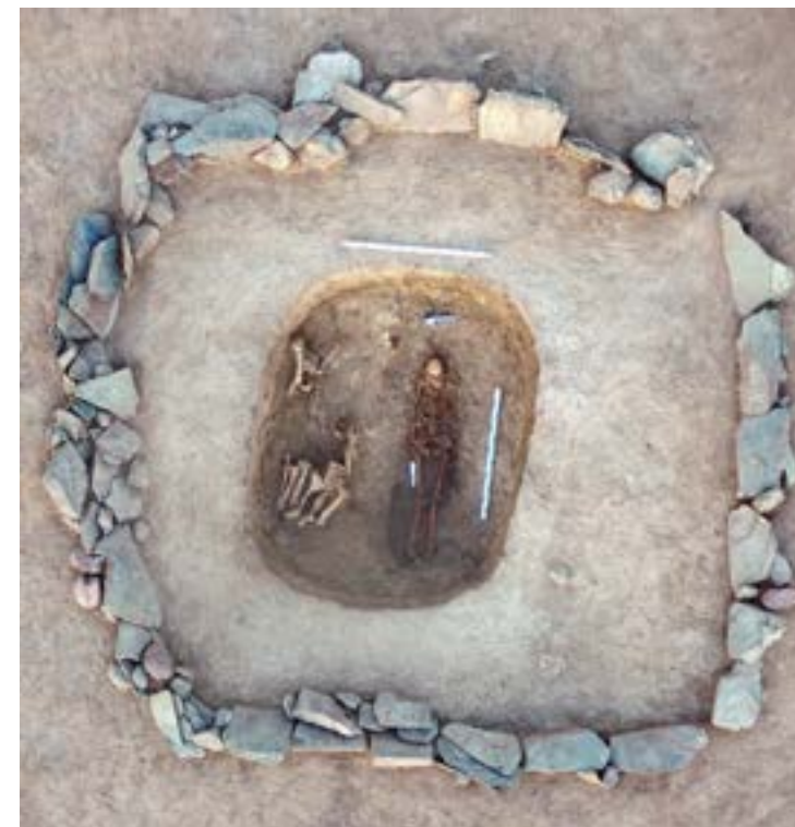
Рис.8. Курган 3. Могильная яма.