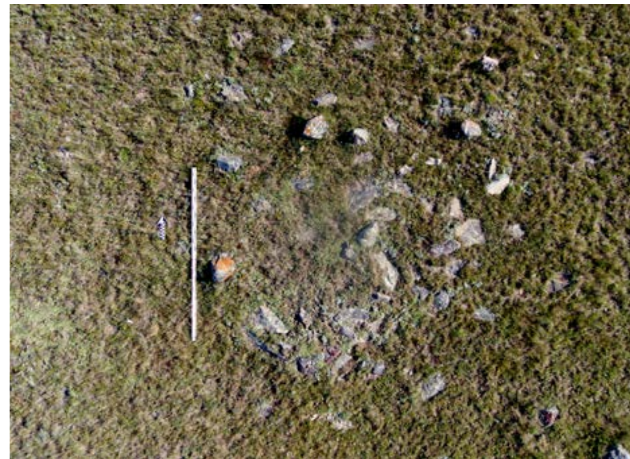
Рис. 1. Курган 2. Вид до раскопа.

Таким образом, особенности погребального обряда исследованных памятников, а также сопроводительный инвентарь позволяют определить их культурно-хронологическую принадлежность. Структура надмогильных и внутримогильных сооружений, сопребение лошади в одном из курганов, а также поза и ориентация погребенных соответствует культуре древних тюрков.