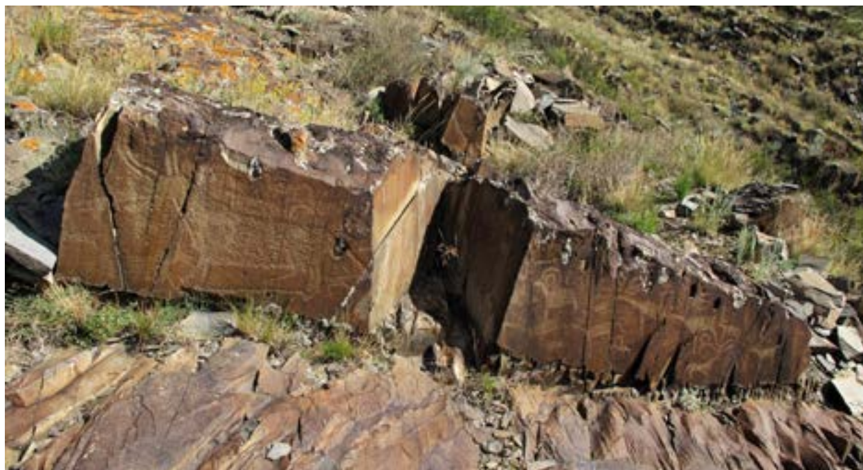
Рис 37. Наскальные изображения Маралды. Горные козлы, маралы, буйвол

САМАШЕВ З 1. , ТОЛЕГЕНОВ Е 1. , НҰСҚАБАЙ Ә 2. , ҚИЯСБЕК Ғ 3.