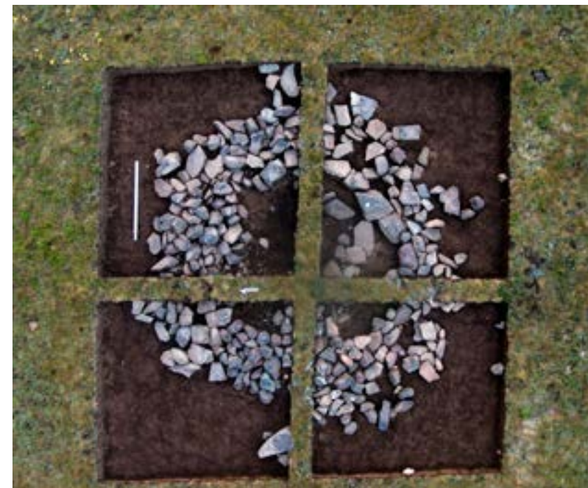
Рис.12. Курган 4. Вид после снятия дерна.