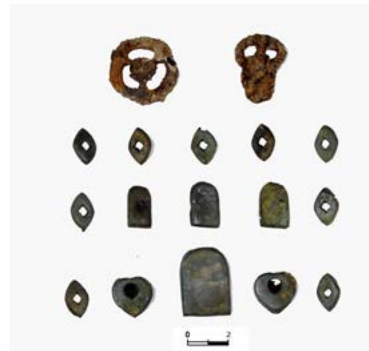
Рис. 9. Курган 3. Детали пояса.