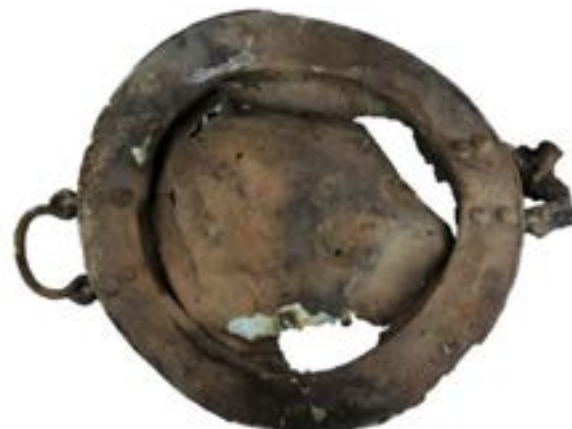
6-сурет – Тұтқалы қазан

Ғибадатхананың ішінде оңтүстік қабырға тұсында пішіні табаққа ұқсас темір бұйым табылды (сурет 6). Бұйымның екі жақ шетінде тұтқасы бар. Ыдыс тәріздес бұйымның астында ағаштың күлі және еріген алтын түйіршіктері табылып жатты. Ғұрыптық құрылыстың шығыс және солтүстік қабырғалары жалпақ тастармен қаланған. Оңтүстік және батыс қабырғалары жұмыр тастармен қаланған.