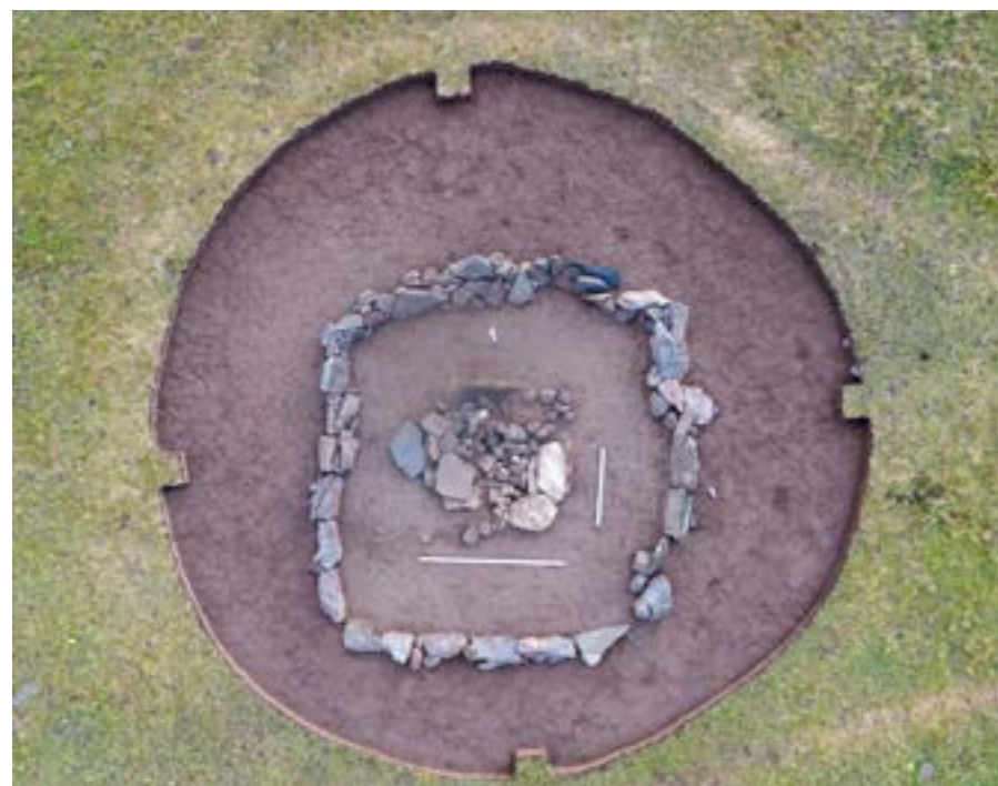
Рис.7. Курган 3. Ограда и перекрытие могильной ямы.