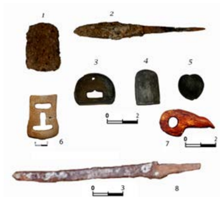
Рис.10. Курган 3. 1 – железная концевая бляшка; 2 – железный наконечник стрелы; 3 – поясная накладка; 4 -7 – детали конской узды; 8 – железный нож.