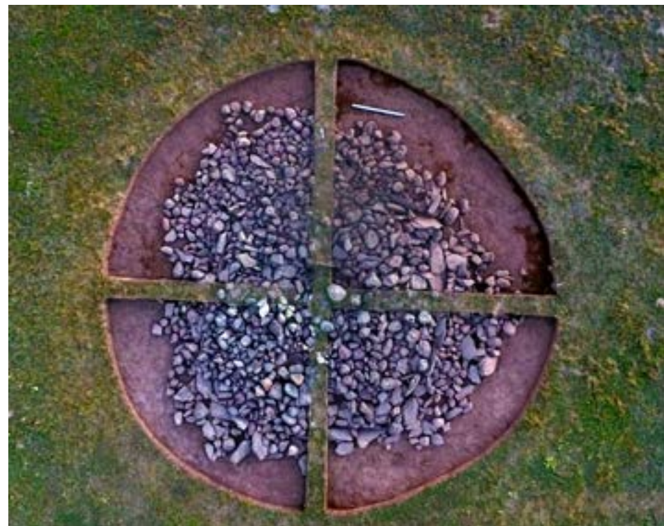
Рис.6. Курган 3. Вид после снятия дерна.