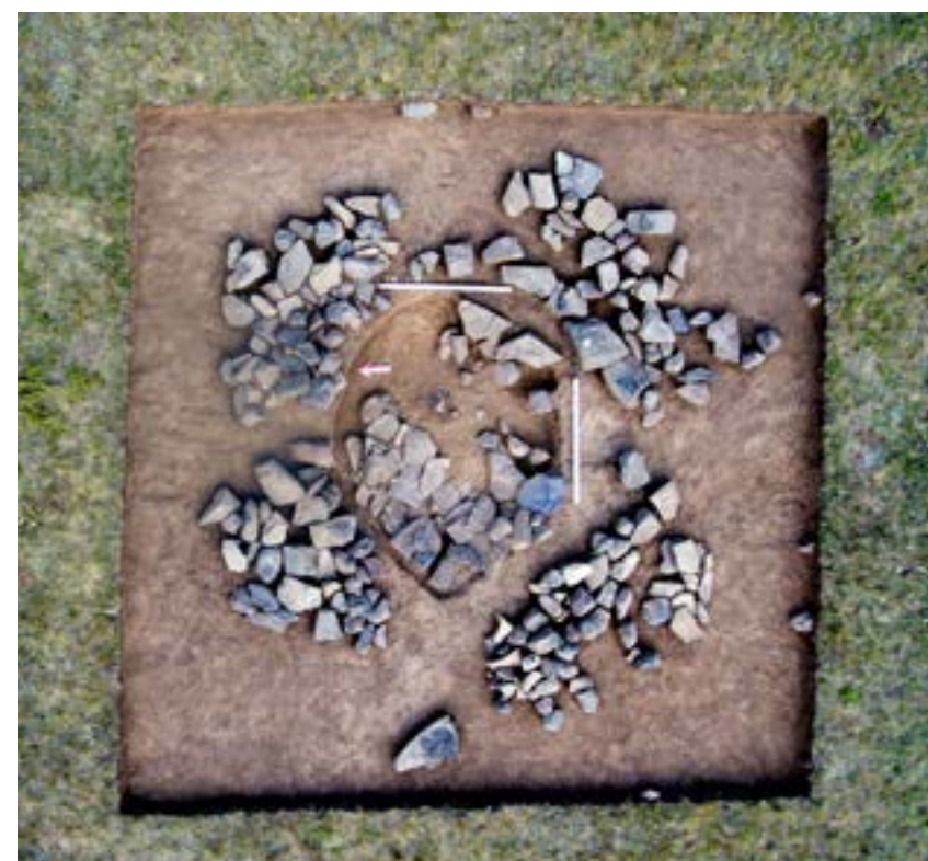
Рис. 13. Курган 4. Яма предназначенная для жертвоприношения.