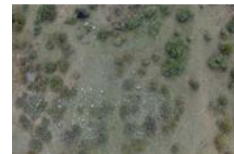
2-сурет – Көкентау. Сегіз тас. Қазбаға дейінгі көрініс.

Қазбаға дейін №1 сегіз тастың айналысында қалың қарағай өсіп тұрды. Дегенмен сегіз тастың пішіні қазбаға дейін анық байқалды (2 сурет). Сегіз тастың барлық тастары қазбаға дейін күндізгі жер қабатының үстіне 10-25 см аралығында шығып тұрды. Шым қабатын тазалау нәтижесінде солтүстік-оңтүстік бағыты бойынша созыла орналасқан. Пішіні сопақша келген тас конструкция анықталды. Тас құрылыс орташа өлшемдері 50x30x20 және 30x20x15 см жалпы саны сегіз болатын гранит тастардан түзілген. Қоршаудың өлшемдері шамамен 3x2 м құрайды. Сегіз тастың топырақпен толтырылған. Қоршаудың қабырға тастары ежелгі жер қабатының үстіне қойылған (3 сурет). Қоршау ішін тазалау барысында өрнектелмеген қыш ыдыстың сынығы мен сүйектің қалдығы табылды. Басқа қандай да бір бұйымдар мен заттар табылмады.