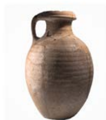
9-сурет – Қыш құмыра

Кешен құрылысының шығыс жақ қабырғасына тас құрылыстың беткі қабатын алып, тазалау жұмыстары жүргізілді. Траншея шығыс бөліктегі қосымша кіре беріс құрылыстың енімен бірдей көлемде салынды.