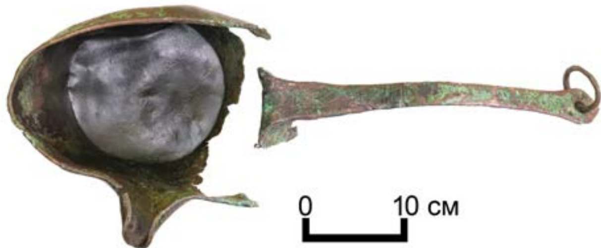
7-сурет – Тұтқалы шүмегі бар ожау

Кешен құрылысының оңтүстік қабырғасының орта тұсында ожау (жез?) тәрізді бұйым және ошаққа қажетті темір бұйымдар, шығыршықпен бекітілген үш аяқты мосы, темір көсеу, аша ауызды бұйым табылды. Ошаққа арналған ұзын темірдің бір ұшы оңтүстік қабырғадағы тастың астына кіріп жатты (сурет 7). Ожаудың сабы 35 см-ға жуық басында сақиналы шығыршығы бар іліп қойуға арналған, ал басының бір жағы шүмектеле жасалған. Біздің пайымдауымызша осы ожаумен қазаннан орталық ошақтың үстіне ғұрыптық от жағар алдында май құйып отырған.