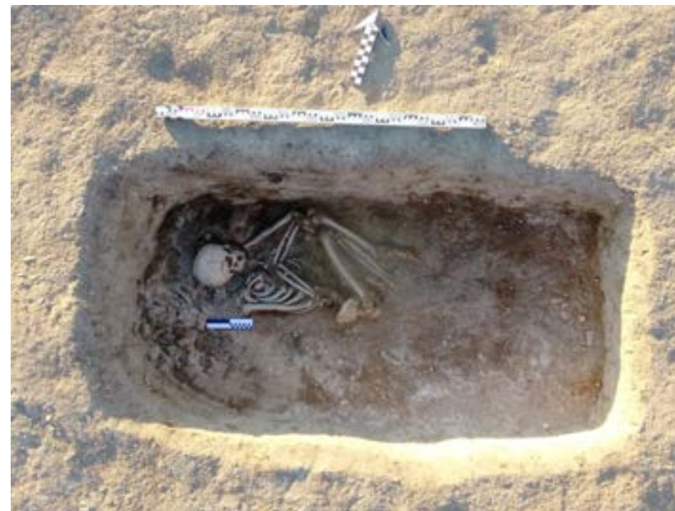
Рис. 4. Курган 2. Могильная яма.