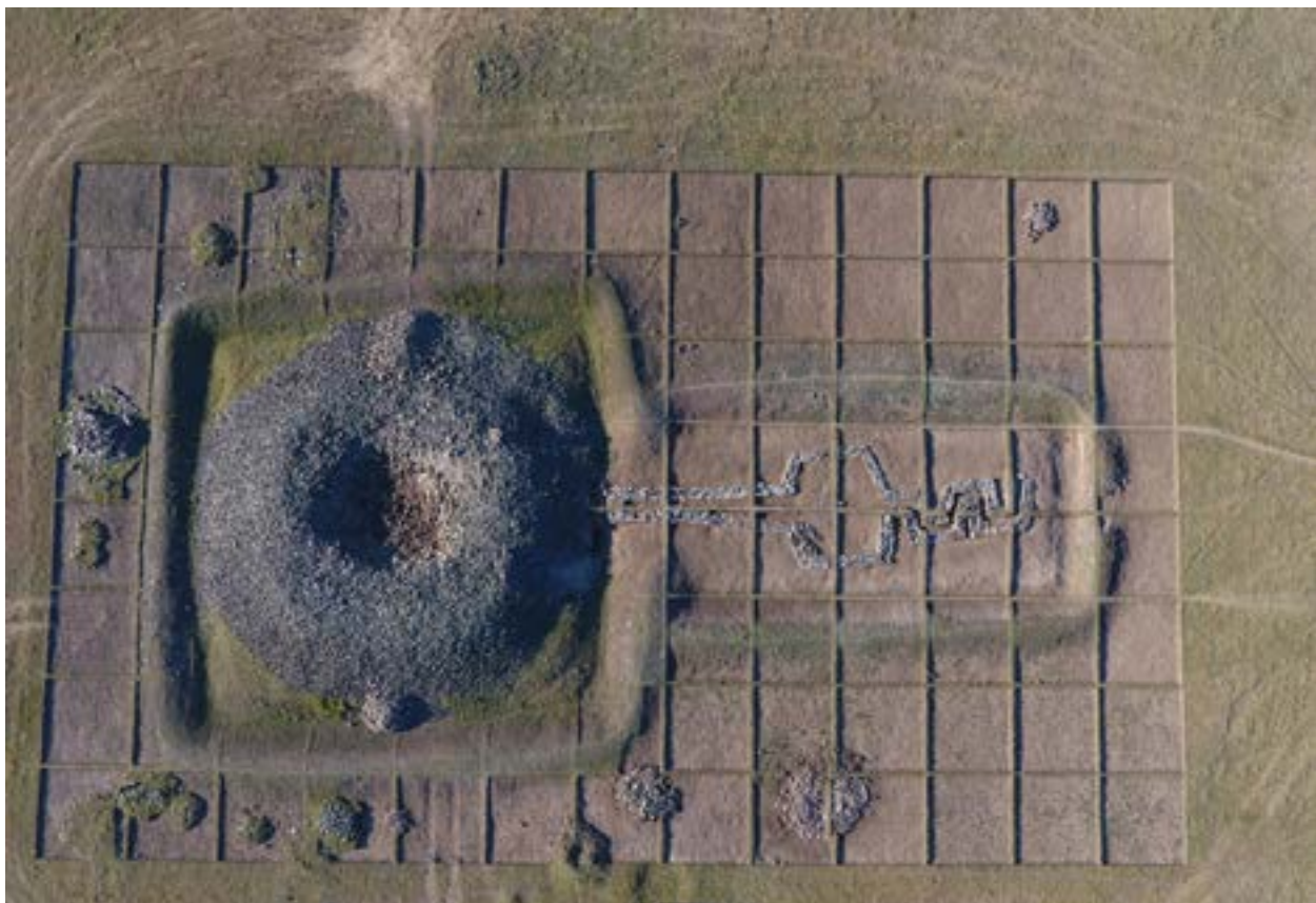
1-сурет – Қаған ғұрыптық-мемориалды кешені. Жоғарыдан түсірілген сурет.

Осы деңгейден ретсіз жатқан алтын әшекейлер және темір бұйымдардың бөліктері табылды.