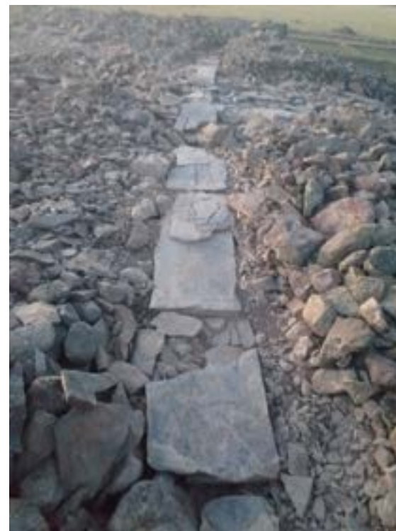
8-сурет – Ғибадатхана қабырға қалауының үсті

Қаған кешені құрылысының шығыс, солтүстік және батыс жақ қабырғаларының орта тұстарынан ені 3 м көлеміндегі аумақтың беткі қабатын бір қабат тас қабаты алынып, тазаланды. Осы атқарылған жұмыстардың нәтижесінде құрылыстың шығыс және батыс жақ қабырғаларының жоғарғы қабатынан бір сызық бойымен тізбектеле қойылған жалпақ тастар тізбегі анықталды. Шығыс қабырғадағы жалпақ тастардың тізбегі толықтай беткі қабаты тазаланып аршылды. Шығыс қабырғадағы жалпақ тастар тізбегі оңтүстік қабырғада тік бұрыш түрінде бұрылған.