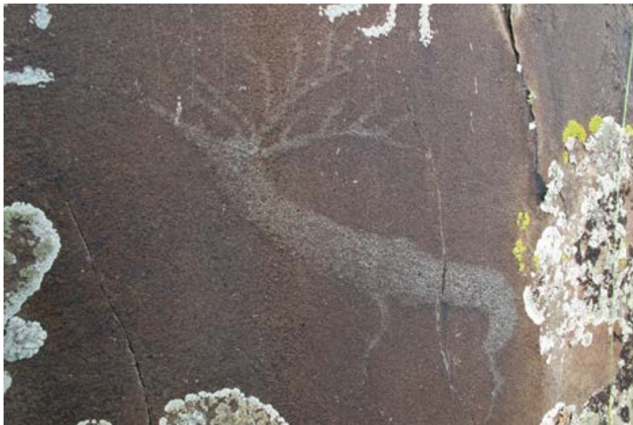
Рис 36. Петроглифы Маралды. Изображение оленя