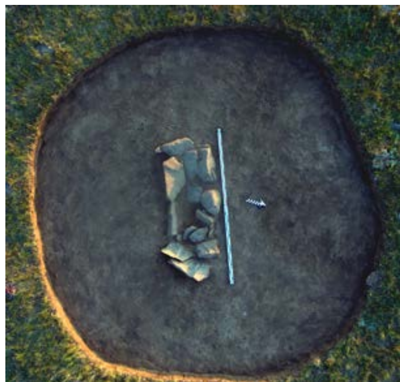
Рис. 3. Курган 2. Перекрытие могильной ямы.