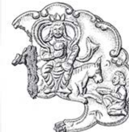
4-сурет – Жартылай еріп кеткен тәжі киіп тақта отырған қағанның алтыннан құйған бейнесі (салған Қ. Ахметжан)