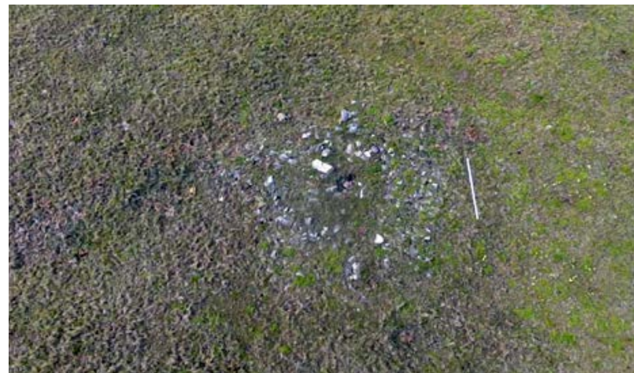
Рис. 5. Курган 3. Вид до раскопа.