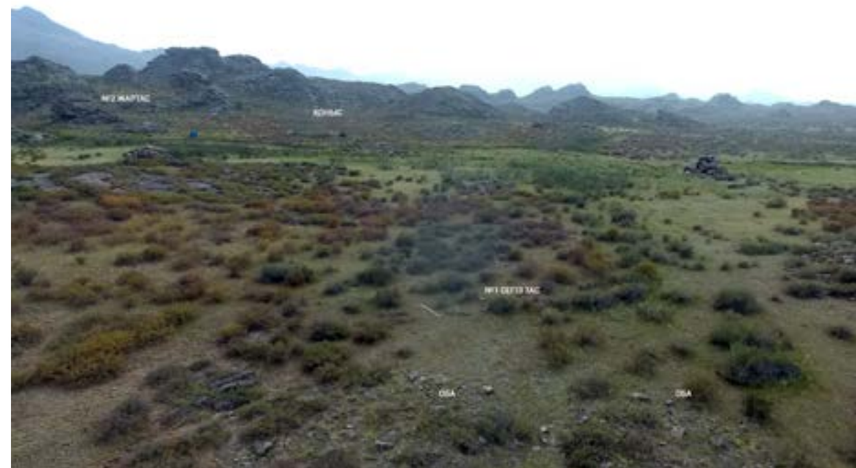
1-сурет – Көкентау. Кешеннің жалпы көрінісі.

Қазбаға дейін алқапта жүргізілген барлау жұмыстарының нәтижесінде солтүстік-оңтүстік бағыты бойынша орналасқан екі тас обадан тұратын обалар тобы анықталды. Солтүстік обаның батыс жақ етегіне жапсыра салынған кішігірім тас құрылыс бар. Екі обадан батысқа қарай шығыстан батысқа қарай созыла орналасқан екі сегіз тас табылды. Биылғы далалық