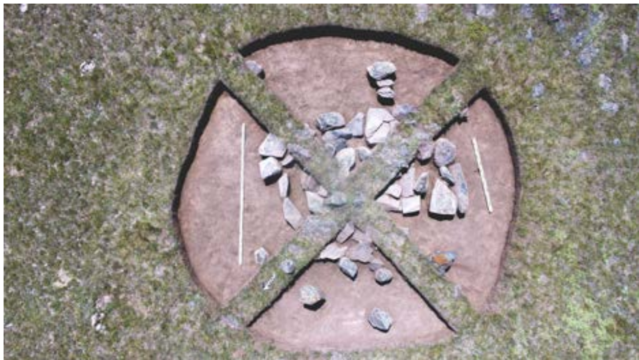
Рис. 2. Курган 2. Вид после снятия дерна.